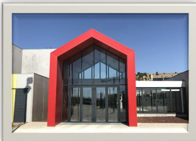
Puerta de Albanta