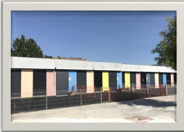
Corralitos de Infantil