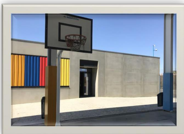
Puerta del parking